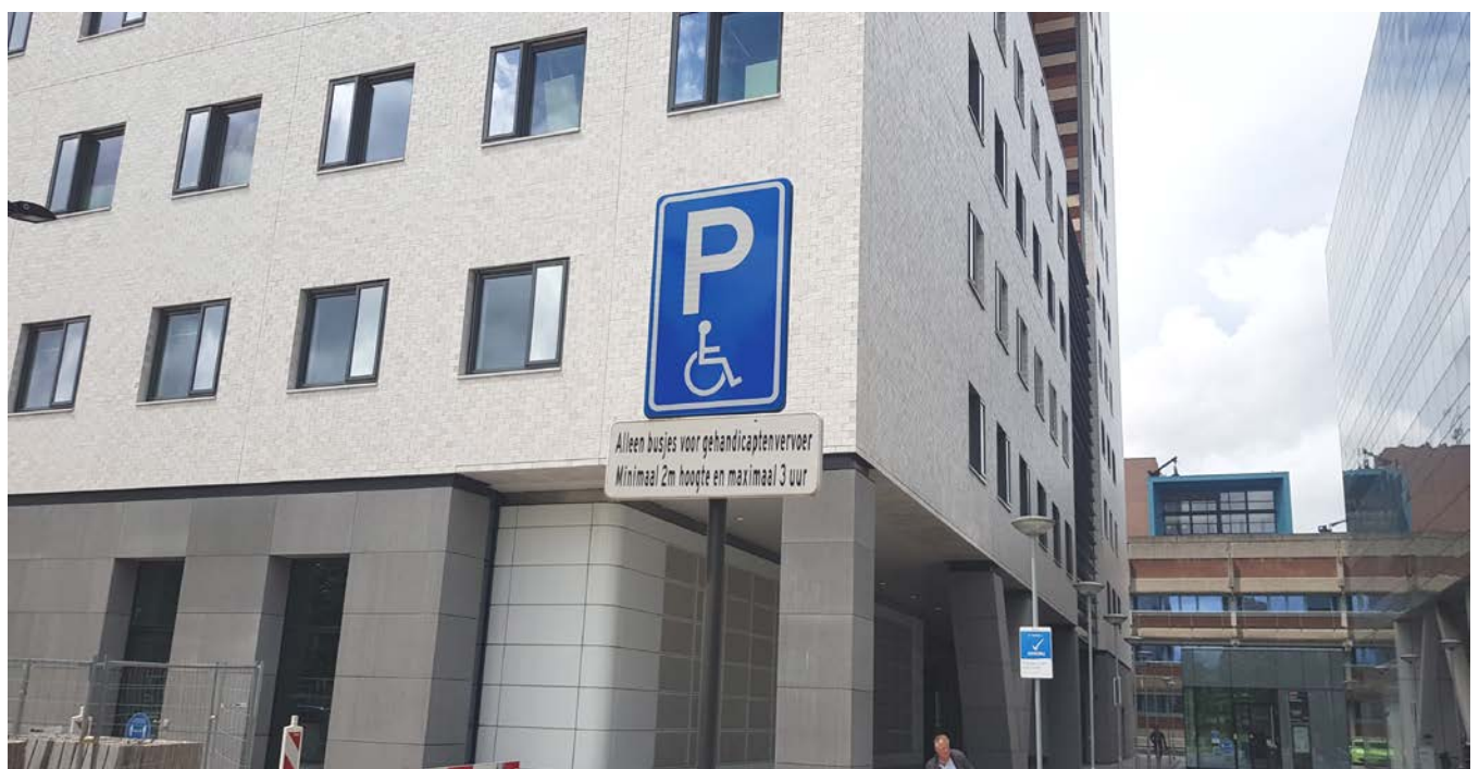
Foto 1: Parkeerplekken vlakbij de ingang van P2 voor het gebouw van de Acta

De ingang van de garage P2 vindt u aan de Gustav Mahlerlaan (zie kaartje onderaan). Borden verwijzen ook naar P2 VUmc.